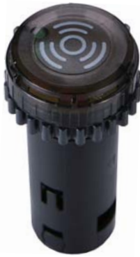
모델명 B2NB - B1D